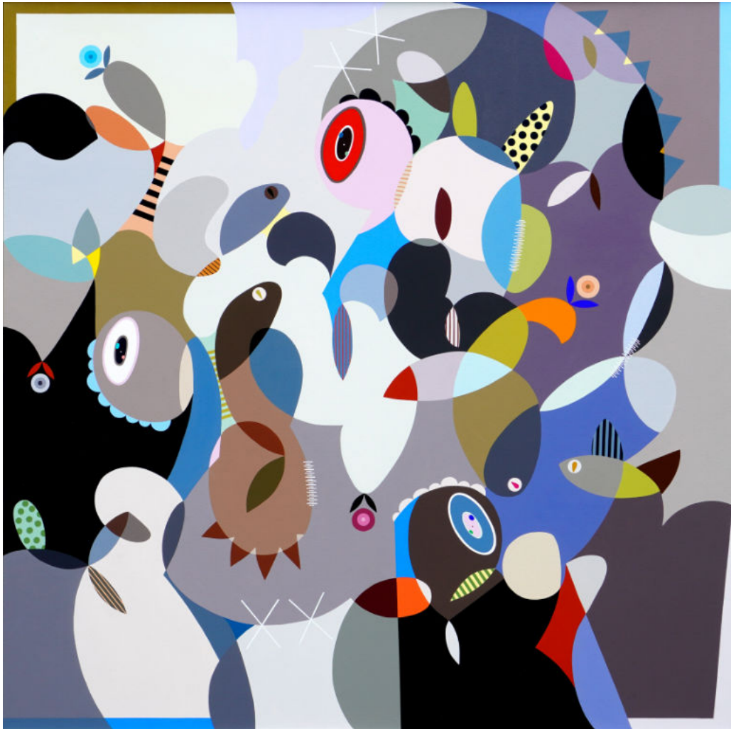
The color of identity | Acrylic on canvas | 150x150 cm | 2023