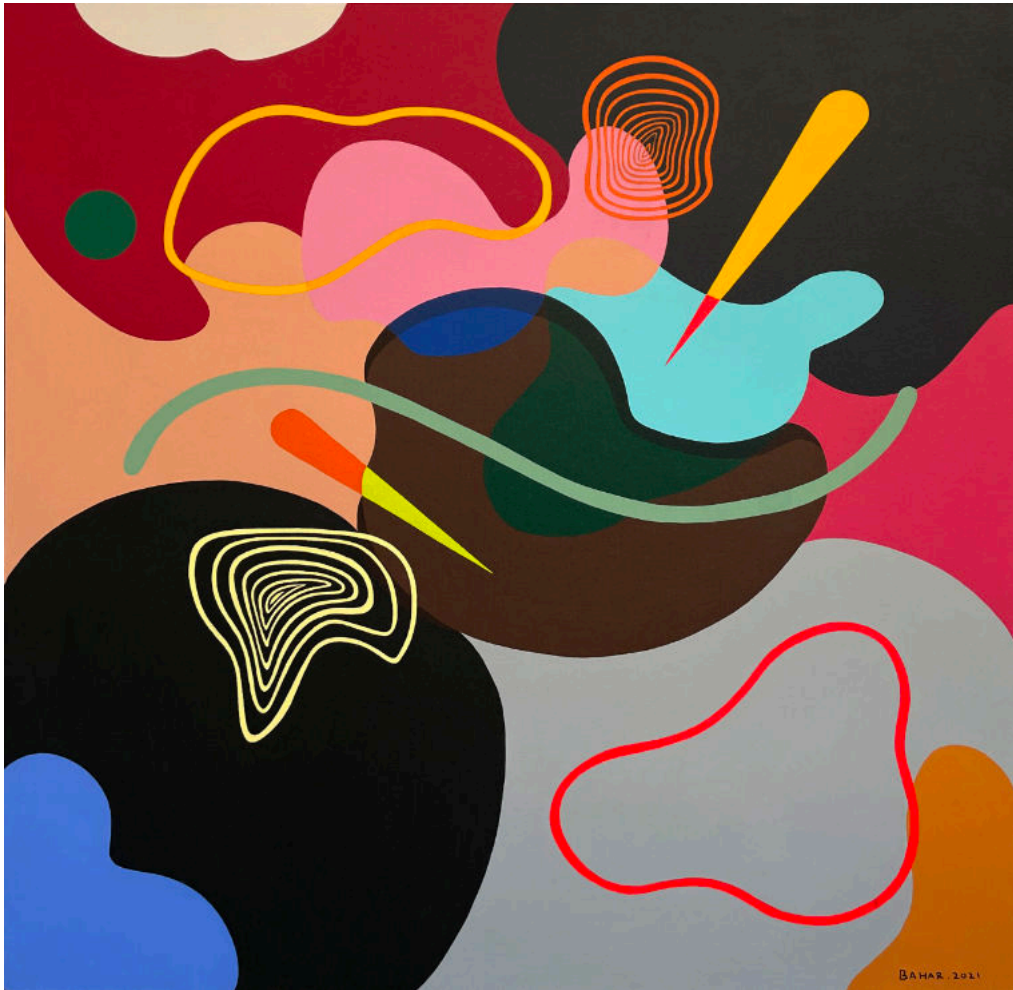
Dibentuk dan dibengkakan #18 | Acrylic on canvas | 100x100 cm | 2021