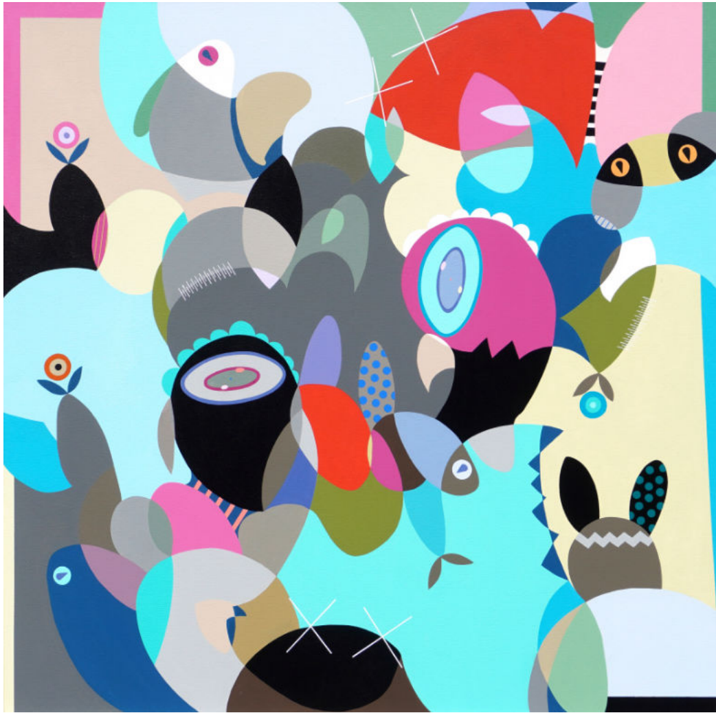
Inner peace | Acrylic on canvas | 100x100 cm | 2023