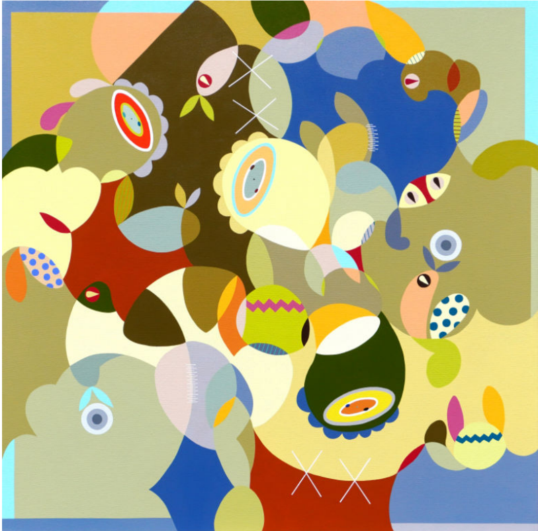
On a sunbeam | Acrylic on canvas | 100x100 cm | 2023