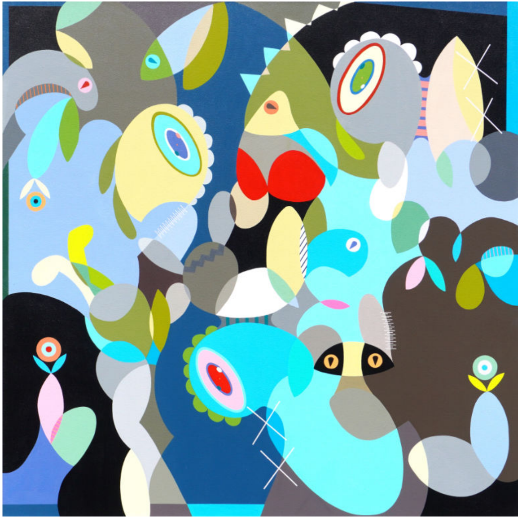
An underwater fantasy | Acrylic on canvas | 100x100 cm | 2023