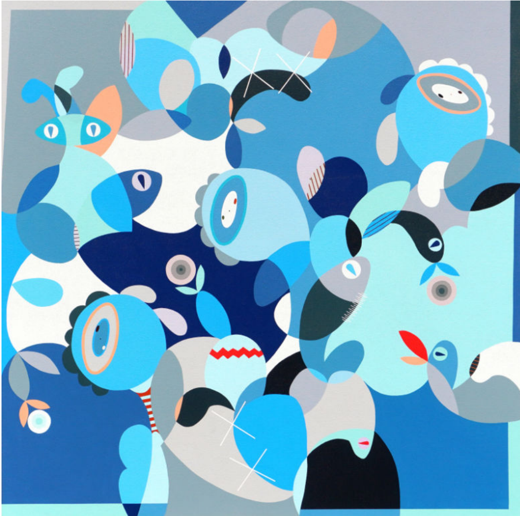
Hope to nature | Acrylic on canvas | 100x100 cm | 2023