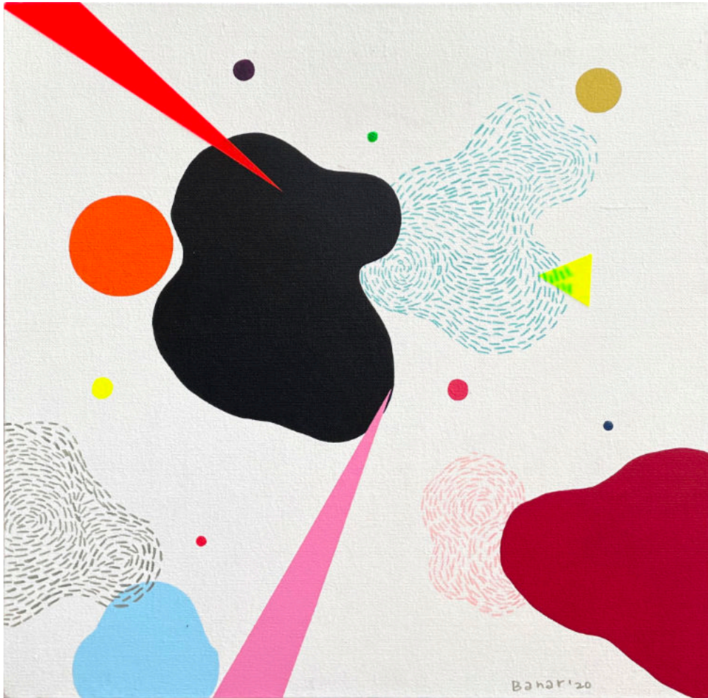
Untitled #1 | Acrylic on canvas | 40x40 cm | 2020