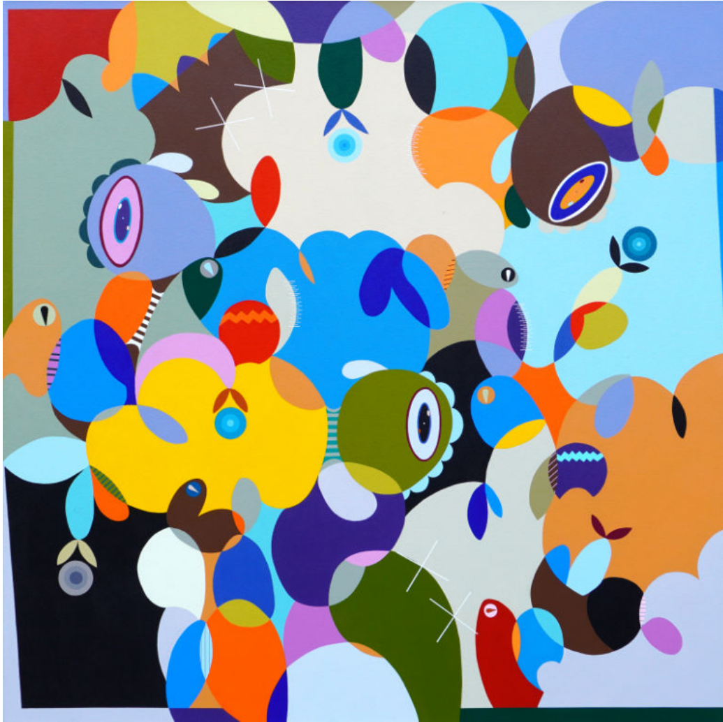
Between the coral reefs | Acrylic on canvas | 120x120 cm | 2023