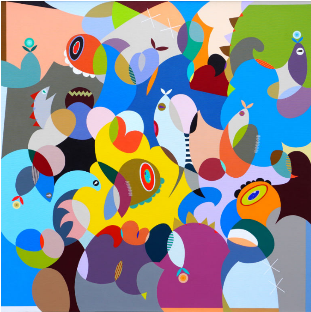
Chasing the light | Acrylic on canvas | 150x150 cm | 2023