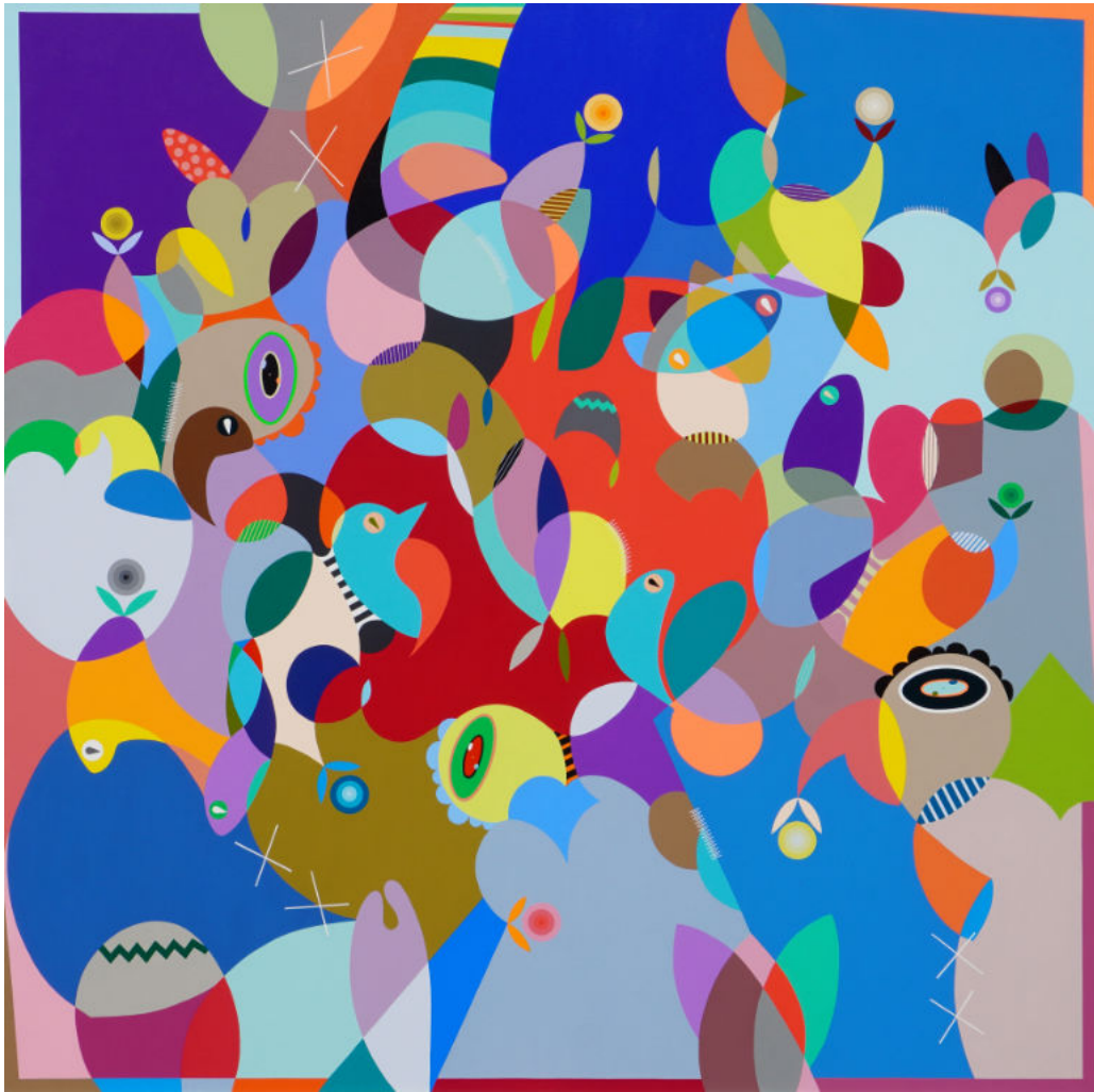
Rainbow in the sea | Acrylic on canvas | 200x200 cm | 2023