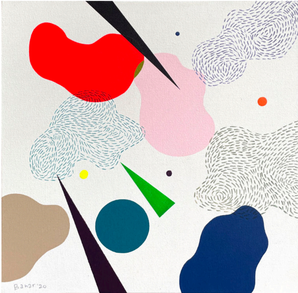
Untitled #4 | Acrylic on canvas | 40x40 cm | 2020