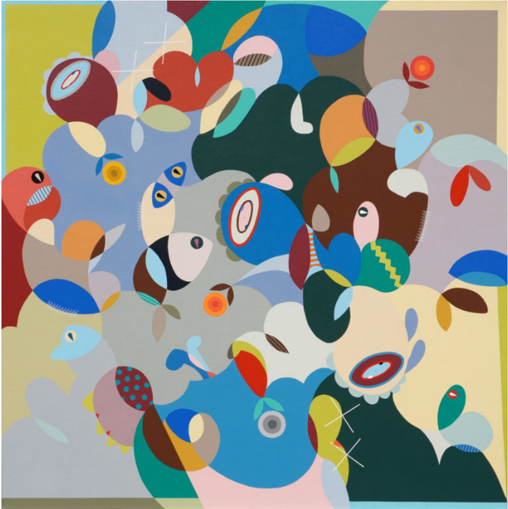
Peaceful | Acrylic on canvas | 120x120 cm | 2023