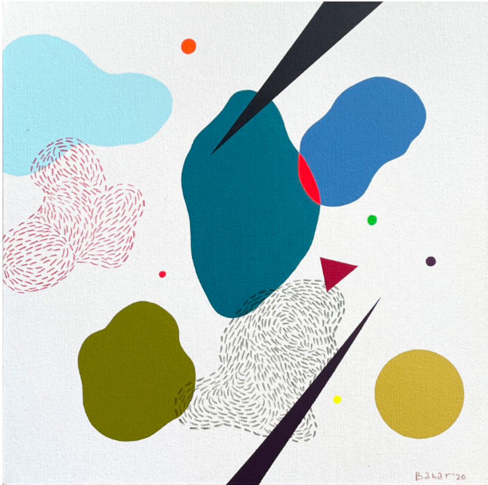
Untitled #2 | Acrylic on canvas | 40x40 cm | 2020