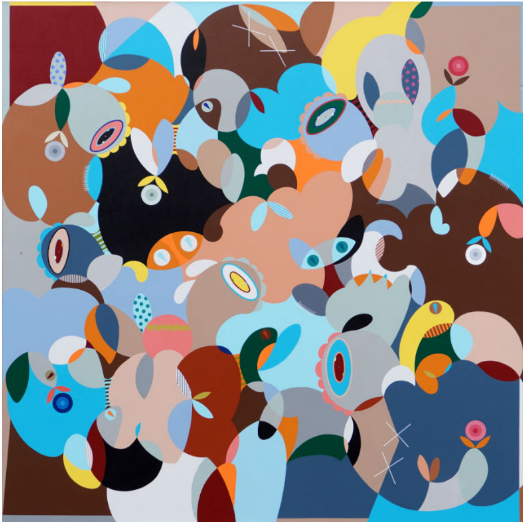
Hopeful | Acrylic on canvas | 180x180 cm | 2023