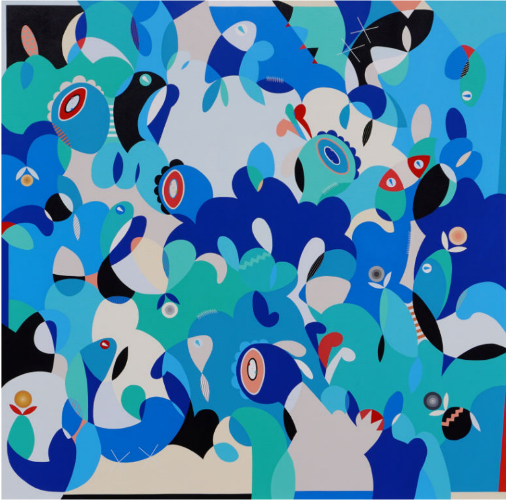
Poetry from the north | Acrylic on canvas | 200x200 cm | 2023