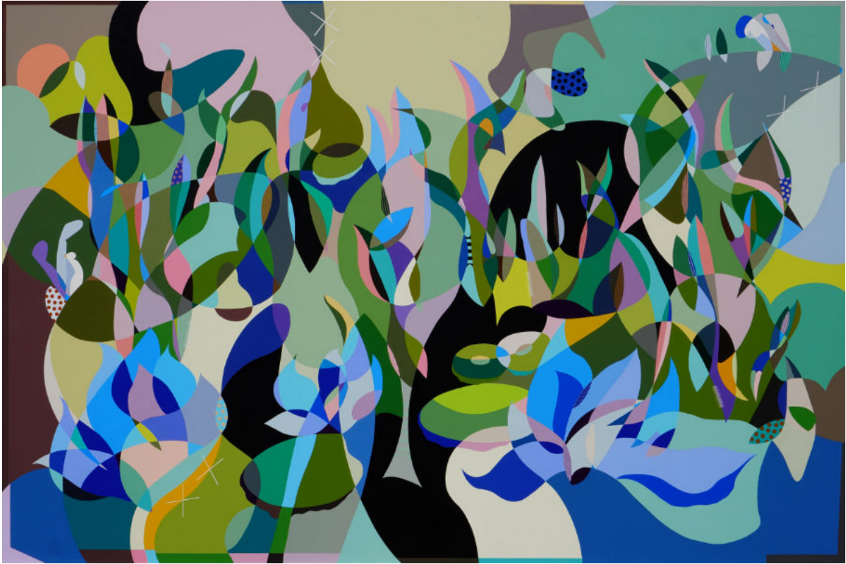
Landscape series #1 | Acrylic on canvas | 200x300 cm | 2023