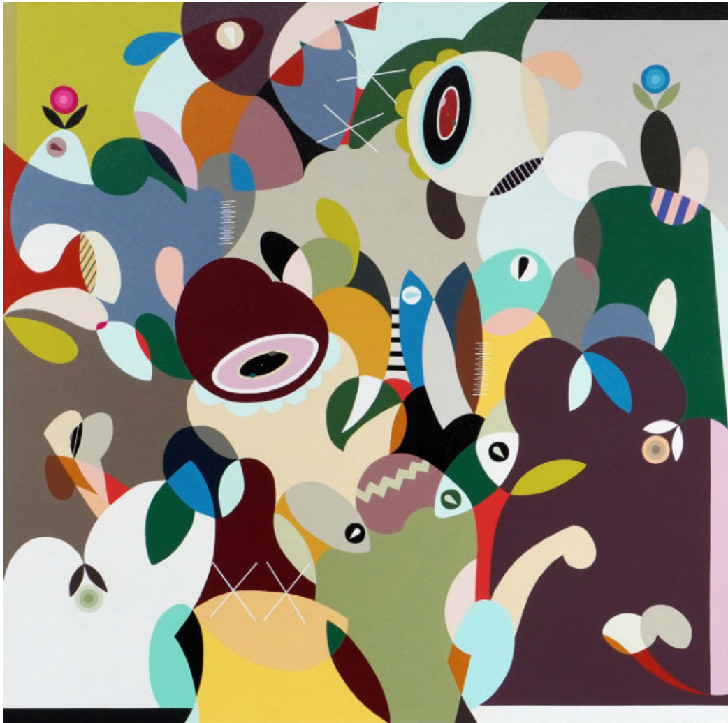
Paradise | Acrylic on canvas | 100x100 cm | 2023