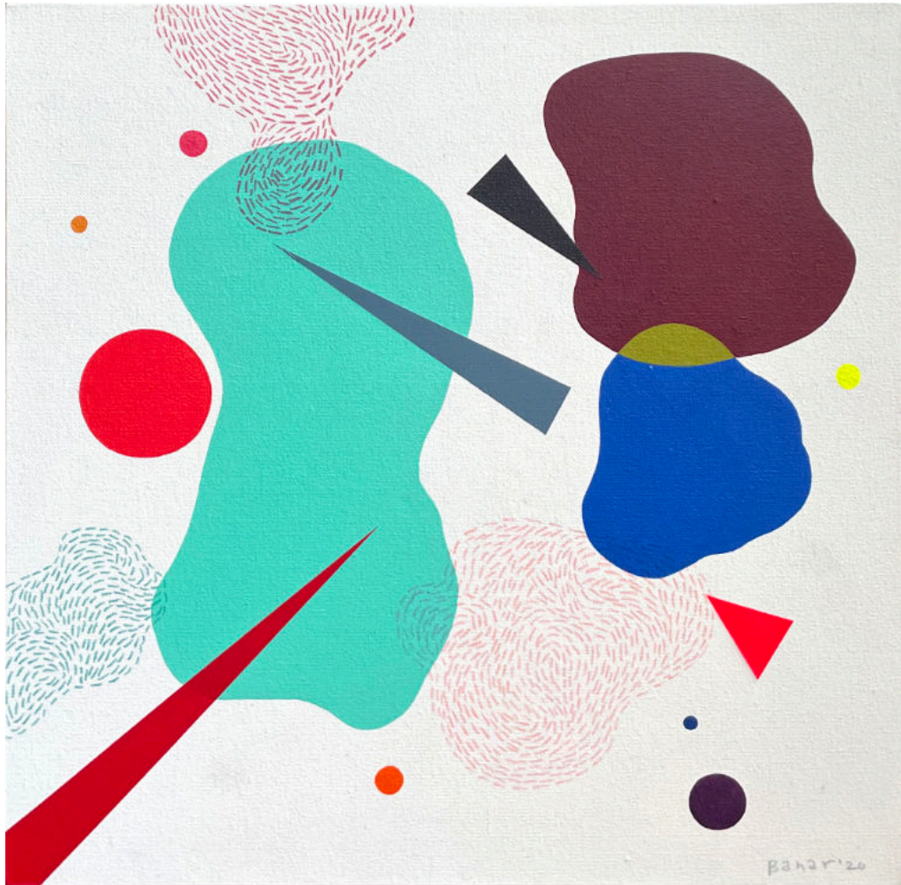
Untitled #3 | Acrylic on canvas | 40x40 cm | 2020