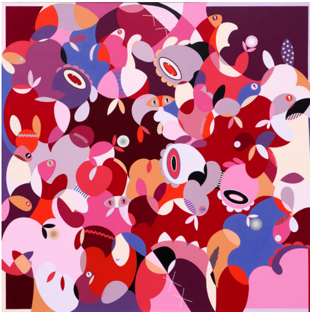
Love story | Acrylic on canvas | 180x180 cm | 2023